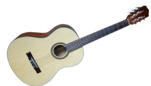
la guitare (duo)