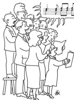
une chorale d'adultes