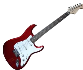
La guitare électrique