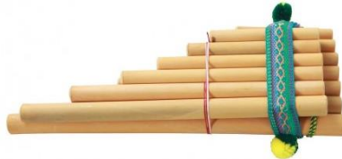
flûte de pan